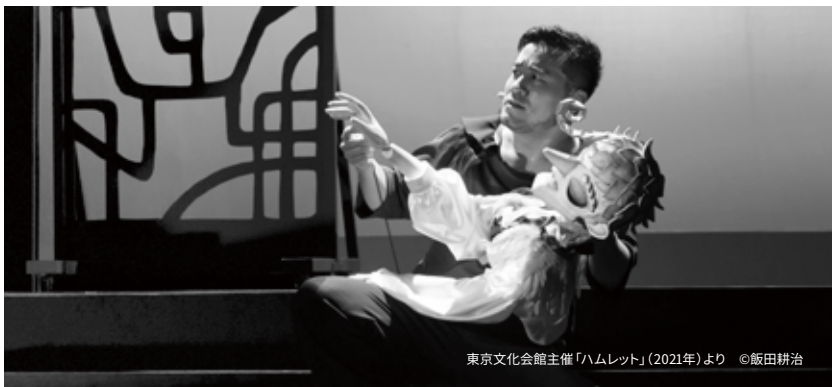
東京文化会館主催「ハムレット」(2021年)より