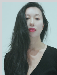
作曲 平野真由 Music HIRANO Mayu