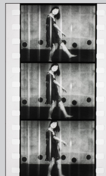
Teinosuke Kinugasa, A Page of Madness, 1926 (restored version), film 35mm, black and white, silent, 67 min., Donated by Society of Japanese Friends of Centre Pompidou, 2019 (Photographs) © right reserved