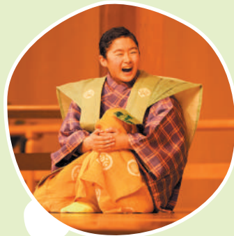
「キッズ伝統芸能体験」発表会より