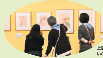
上野アーティストプロジェクト2023 いのちをうつす 一菌類、植物、動物、人間

ミュージアムには人々が昔から守ってきたものや、まだ解き明かされていない謎や未来のことまでたくさんの不思議が詰まっているよ。上野公園は、そんなミュージアムが9つ。世界中から本物が集まる特別な場所。ミュージアムの扉を開いて、今と昔、未来を巡り、探求する冒険に出かけよう!