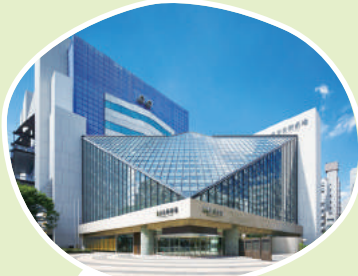
東京芸術劇場外観