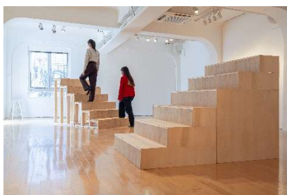
9. 6steps 「6steps を置いてみる —TOKAS 本郷編—」