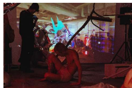
7. 花形 楨 「A Garden of Prosthesis」