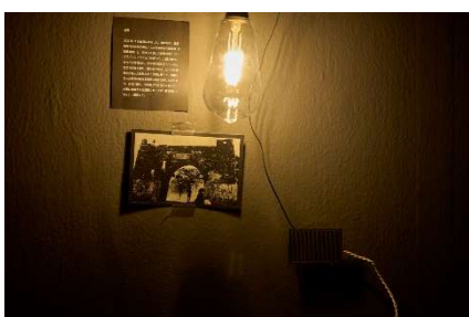
4. すずえり 「移動について」