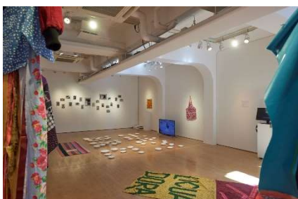
8. 岩間香純 「Solidaridad Feminista : エクアドルと日本から みるアート・アクティビズムの可能性」