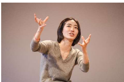
5. ルサンチカ 「SO LONG GOODBYE」