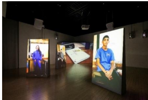
左：荒木悠《Road Movie》2014 年／15 分 42 秒 ©Yu Araki / Image Courtesy of the artist and MUJIN-TO Production 右：金仁淑（キム・インスク）《Eye to Eye》2023 年 [参考図版] 恵比寿映像祭 2023 コミッション・プロジェクト Photo：新井孝明