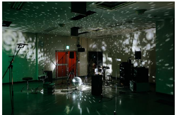
《O階》2020 「さいたま国際芸術祭2020」展示風景 (旧大宮区役所)