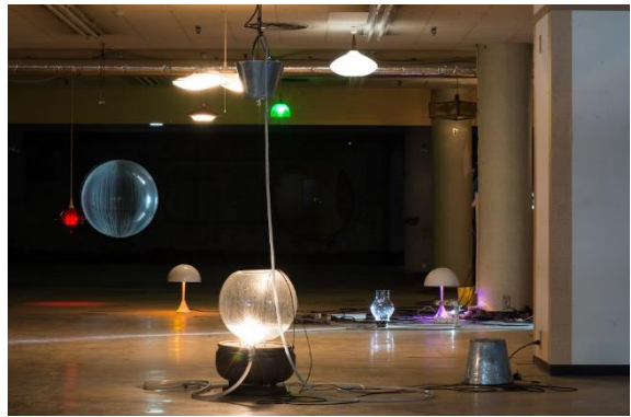
《わからないものたち》《りんご》2017 「札幌国際芸術祭2017」展示風景 (金市館ビル/りんご)