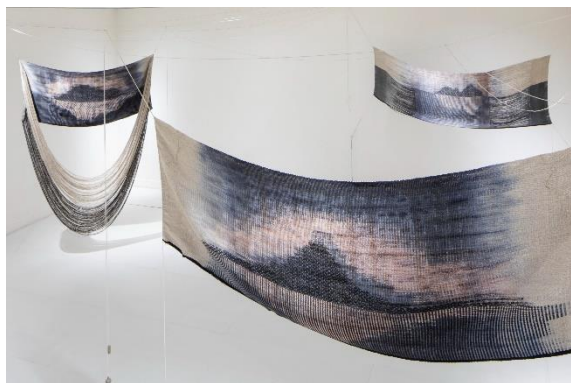
《海図》 2017-2019