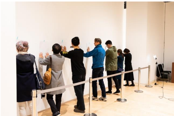
「うたの起源」展示風景 (福岡市美術館、2019)