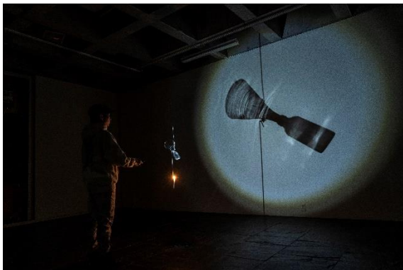
「wait this is my favorite part 待ってここ好きなとこなんだ」展示風景 (ワタリウム美術館、東京、2023)

近年の主な展覧会や公演に、個展「wait this is my favorite part 待ってここ好きなとこなんだ」(ワタリウム美術館、東京、2023)、「奥能登国際芸術祭 2023」(珠洲、石川)、個展「梅田哲也 イン 別府『O滞』」(別府各所、大分、2020)、個展「うたの起源」(福岡市美術館、2019)、「東海岸大地芸術節」(台東、台湾、2018)、また、パフォーマンスとして「Kunstenfestivaldesarts 2017『Composite: Variations / Circle』」(ブリュッセル)など。