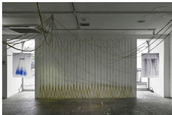
《記憶をまとう》 2014