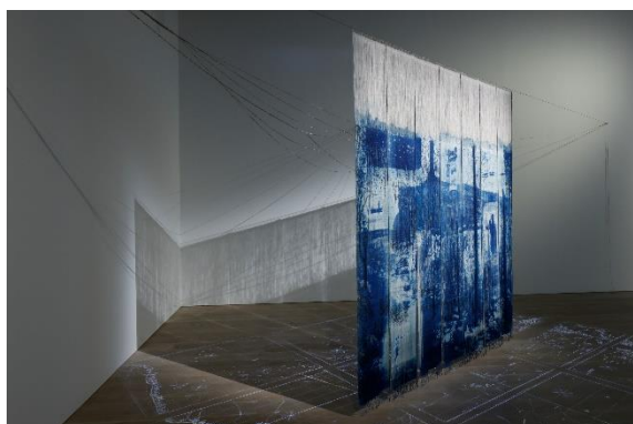
《海鳥たちの庭》 2022 「六本木クロッシング2022展：往来オーライ！」 展示風景 (森美術館、東京)

近年の主な展覧会に、「KANTEN 観展：The Limits of History」(Apexart、ニューヨーク、2023)、「六本木クロッシング 2022 展：往来オーライ！」(森美術館、東京)、「展示と対話のプログラムアートセンターをひらく 第II期」(水戸芸術館現代美術ギャラリー、2019)、個展「手にたくす、糸へたくす」(小山市車屋美術館、栃木、2019)、「交わるいと『あいだ』をひらく術として」(広島市現代美術館、2017)、個展「一仮想の島— grandmother island」(MATSUO MEGUMI + VOICE GALLERY pfs/w、京都、2017)など。