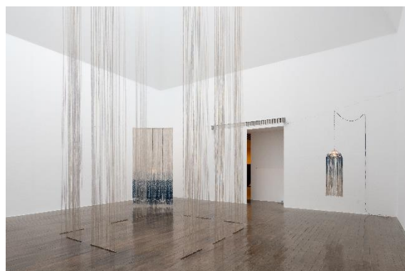
《彼女の部屋にとどけられたもの》 2019