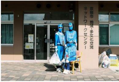
4. スウィング 2022年