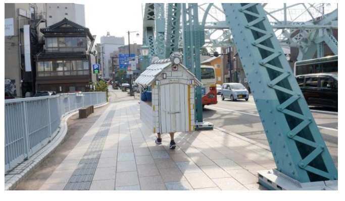
村上慧《2018年8月30日石川県金沢市》2018年 作家蔵