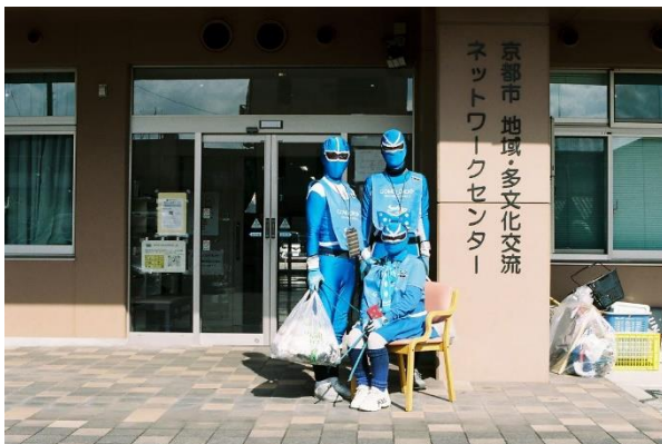
スウィング 2022 年

会期中、作家のパフォーマンスやトークイベントなどさまざまなイベントを実施するほか、本展をより深く楽しむための「ウォーミングアップ企画」として、2024年1月13日（土）から1月28日（日）、2月3日（土）にプレイベントを開催いたします。