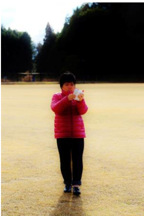
3. 酒井美穂子《酒井美穂子・本人》2015年

神奈川県川崎市生まれ。現代美術の前線で40年近く活躍する現代美術家。顔にパンを巻き付け街中に繰り出すパフォーマンス「パン人間」や自身の母の介護を作品とする「アート・ママ」など、生活と芸術の境界を揺るがしながら、コミュニケーションのあり方を愛とユーモアを交えて問いかける作風が国際的に高い評価を受けている。近年の主な個展に「折元立身-昔と今-」（尾道市立美術館 [広島]、2018年）など、国内外の美術館での展示歴が多数ある。