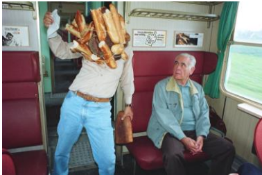
2. 折元立身《パフォーマンス：パン人間電車の旅》 1992年 作家蔵