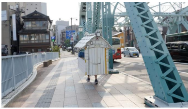
5. 村上慧《2018年8月30日石川県金沢市》 2018年 作家蔵

スウィングは2006年より京都にて活動を開始した、障害のある人ない人およそ30名が働く福祉施設。既存の仕事観や芸術観にとらわれない自由な仕事や表現活動を基軸とした事業を行っている。清掃活動「ゴミコロリ」、絵画や詩やコラージュの創作活動「オレたちひょうげん族」のほか、展覧会の実施やフリーペーパーの出版、ラジオ配信など、自主的な発信を伴う活動は多岐にわたる。近年の展示に「Swing×成田舞×片山達貴 展覧会『blue vol.2 一捨てられないものが物語ること』」(THEATRE E9 KYOTO [京都]、2022年) などがある。