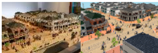
左：江戸東京博物館の銀座煉瓦街の模型 右：アプリの3DCG空間