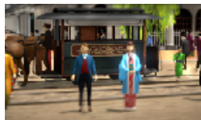
左：アキラくん 右：ハルちゃん

約260年続いた江戸時代が終わりを迎えた明治初年（1868年）から物語はスタートします。江戸と呼ばれていた都市は「東京」へその名を変え、明治時代が幕をあけます。西洋からの思想や技術、価値や文化を取り入れて近代国家へ躍進する日本。本アプリは、こうしたためまぐるしく変わる銀座の街、文明開化に生きた、ある家族の物語でスタートします。