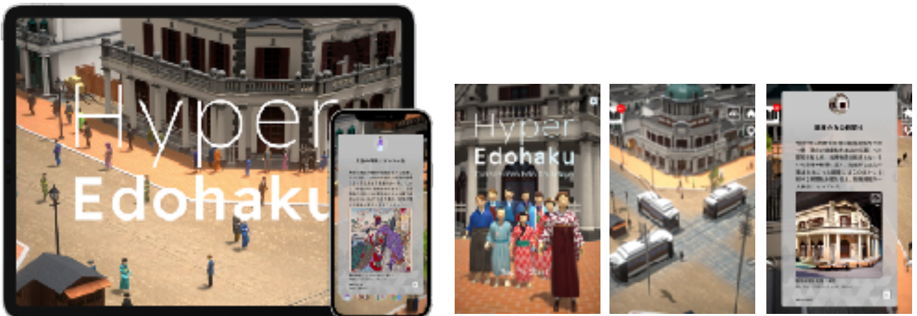
江戸東京博物館スマートフォンアプリ「ハイパー江戸博 明治銀座編」（4月26日リリース）

江戸博の収蔵品で「東京のはじまりをさがす、みつける、あつめる」 西洋化がすすむ明治時代の銀座を時間旅行しながら、 現代につながる文化や習慣を見つけよう