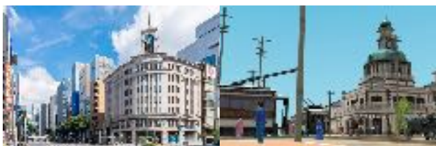
左：現在の銀座四丁目 右：アプリで再現された明治時代の街並み

第1弾と同様に、登場するキャラクターとの会話をヒントに、アプリに隠された收藏品を探すことに加え、第2弾では4つのステージで時間と場所を移動する「時間旅行」を楽しめます。さらに、收藏品の3Dデータを使ったAR機能が新たに加わりました。