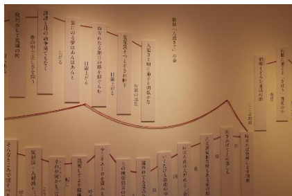
9. 高松 霞 「連句の赤い糸」