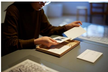
8. サトウアヤコ 「日常記憶地図 『“家族”の風景を“共有”する』」