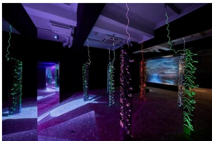
1. 菅 実花 「鏡の国」