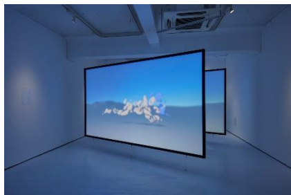
2. 米澤 柊 「名無しの肢体」