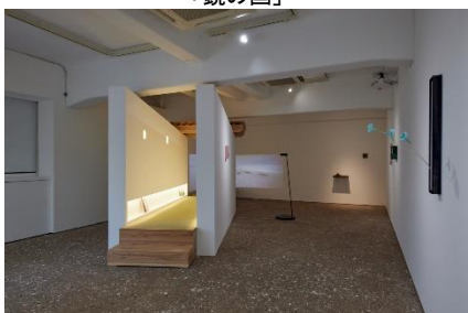
4. ルイズ・ラウス & アグスティン・スピネット 「Sounds from Liminal Town」