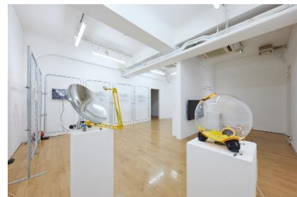
3. Excitation of Narratives (EoN) 「話法の生成 —Essay Film の立地—」