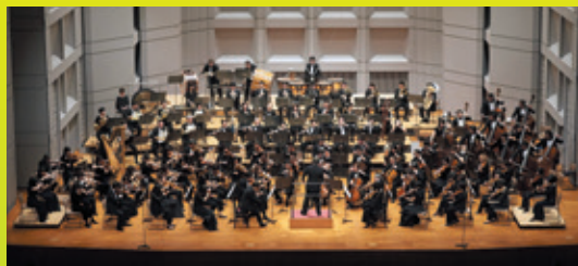
管弦楽 東京フィルハーモニー交響楽団 Tokyo Philharmonic Orchestra