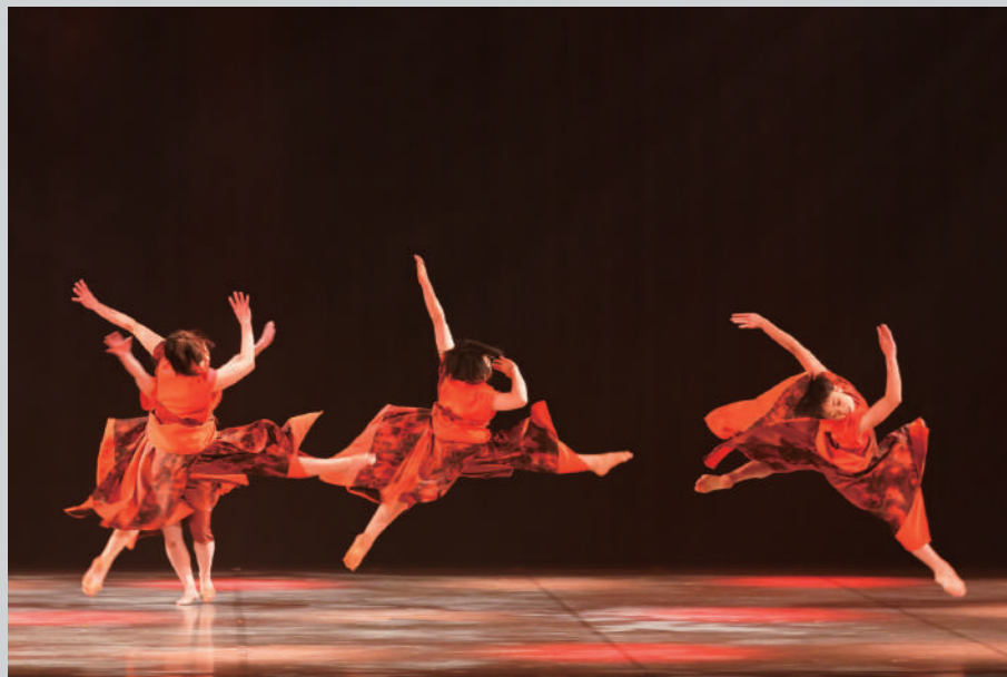
2021年公演 / 撮影：冨田了平