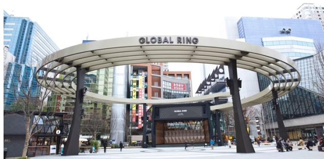
GLOBAL RING THEATRE (グローバルリング シアター)

街の只中で、夕景から夜に掛かる時間、喧騒さえも芝居の一部になる都会の野外劇。その異空間をご堪能ください。