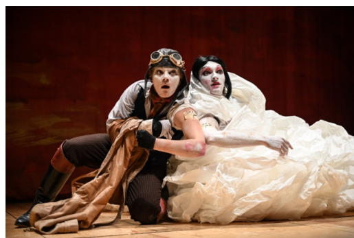
『The Scarlet Princess』（2018年）