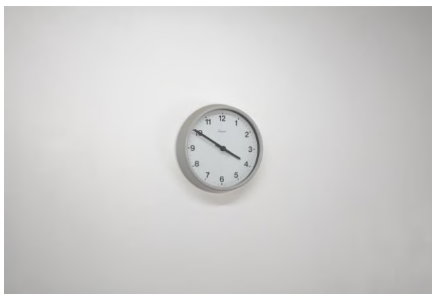
8 良知 暁 《15:50》(「シボレート / schibboleth」における展示) 2020-21 年

リリースのお問い合わせ：東京都現代美術館 事業企画課 企画係 広報班 工藤・砂長・内堀