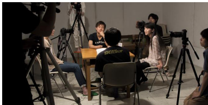
2 高川和也 《CONSENSUS》2014 年