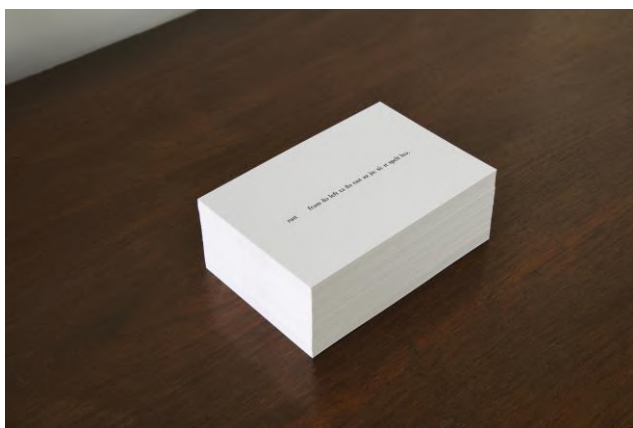
7 良知 暁 「シボレート / schibboleth」のためのエフェメラ 2020-21 年

1980 年生まれ。ボーンマス美術大学写真学科卒業。近現代史、特に投票制度にまつわるリサーチに基づく作品制作や、歩行や質問など日常の行為を通じた芸術実践を行う。時にテキストや写真、パフォーマンスなどに展開されるそれらの実践からは、制度や表象が持つ政治性や過去の出来事に対する断続的な想起の可能性が見いだせる。発話の差異によって区別される歴史をめぐる「シボレート / schibboleth」は、曖昧なまま理不尽に敷かれる分断線と、それを生み出し、翻弄される人々についての思索となった。本展では、同展示の再構成を試みる。