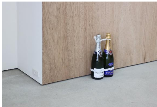
《Drinking》2021 スパークリングワイン、USB-C ライトニングケーブル

1992年山形県生まれ。2019年東京藝術大学大学院美術研究科先端芸術表現専攻修了。