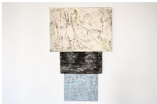
《記憶の受け皿》2020 アクリル、石膏、パネル、キャンバス

1996年神奈川県生まれ。2020年東京造形大学大学院造形研究科造形専攻美術研究領域修了。