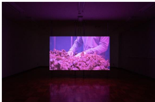
《THE ROOM》2021 映像

1987年群馬県生まれ。2012年東京藝術大学大学院美術研究科デザイン専攻修了。