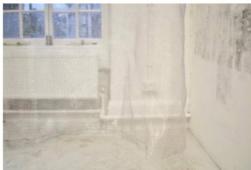
《Nothing Happens》2019 インスタレーション

1996年兵庫県生まれ。2020年ロンドン芸術大学チェルシー・カレッジ・オブ・アート・アンド・デザイン卒業。