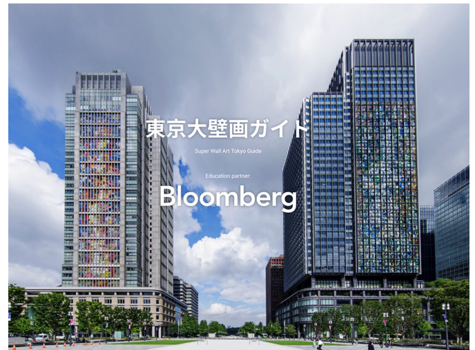
東京大壁画ガイドマップ

利用料：無料 ※ガイドコンテンツの視聴にかかる通信費等は各自のご負担となります。