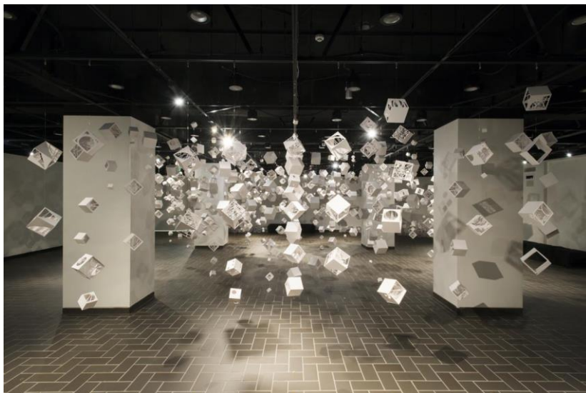
都美セレクション グループ展公募 第1回「STAR DUST」会場風景