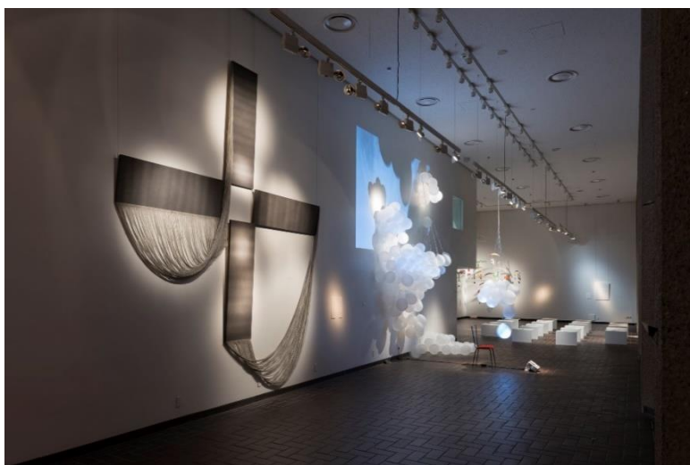
都美セレクション グループ展 2018「蝶の羽ばたき Time Difference 時差 vol.3 New York-Seattle-London-Tokyo」会場風景