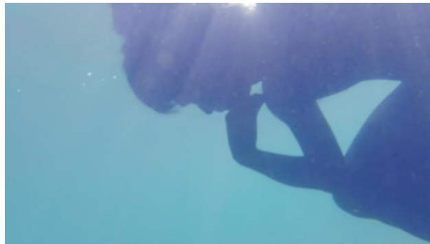
4 潘逸舟《海で考える人》2021年