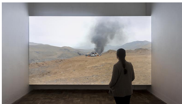
6 マヤ・ワタナベ《Sceneries II》2016年 展示風景