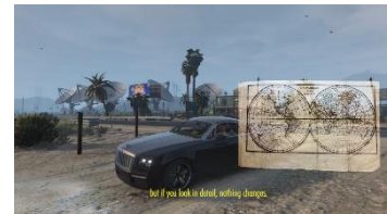
Matteo Messina, Pawns of Furthest East (onlineversion), 2019

このストーリーは、自分の所有するアマゾンのアレクサに支配されて生活する少年メックスと、そのような現実から逃げ出すことに成功し最極東に住む少女マッドアについて話です。メックスはデータの砂漠をゆく厳しい旅に参加することになります。奇妙な谷の陰鬱な森では驚愕の出会いが待ちかまえています。