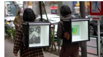
DELIVERY BOX PROJECT

デリバリーボックスを模したギャラリーに作品を設置し移動展示を行う「DELIVERY BOX PROJECT」は、〈移動が制限される世相における移動式ギャラリー〉と銘打ったプロジェクトです。デュシャンの「トランクの中の箱」や小沢剛の「なすび画廊」といった移動式ギャラリーの歴史を辿りつつ、コロナ禍がもたらした雇用悪化と外出自粛に裏付けされた路上の景色に擬態しながら街中を移動します。