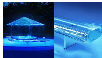
《ガラスの茶室 - 光庵》コバルトブルーのライトアップ 2021年 国立新美術館 (六本木アートナイト・スピンオフ・プロジェクトでの展示イメージ)