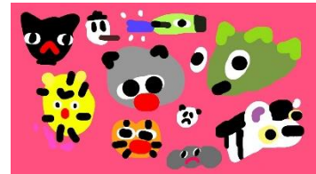
By Dante Zaballa and Osian Efnisien

誰も想像だにできなかった独創的な映像のなかで私たちをとりまいている自然世界を覗いてみよう。