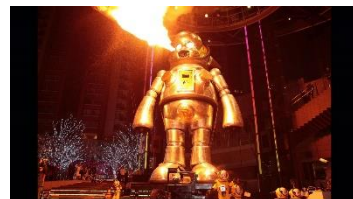
第一回「六本木アートナイト2009」 体長7.2m!!六本木ヒルズアリーナに出現したヤノベケンジによる 機械彫刻『ジャイアント・トラヤン』

2003年に六本木ヒルズ、2007年に国立新美術館と東京ミッドタウンが誕生し、街の機能や性格が変化しつつあった2009年、六本木アートナイトは誕生しました。たった二日、しかも日没から夜明けの時間帯がコアタイムというスタイルは日本における地域アートフェスティバルの中でも一際異彩を放っています。夜というシアトリカルな時間にインスタレーションが見慣れた都市風景を一変させ、動的なイベントが人々にアドレナリンの放出を促す—その絶妙なブレンドこそが、このフェスティバルをここまで成長させたのかもしれない。コロナ禍の中での変貌を模索するためにも、このフェスティバルがどのような意志で始まり何を目指してきたのかを検証します。