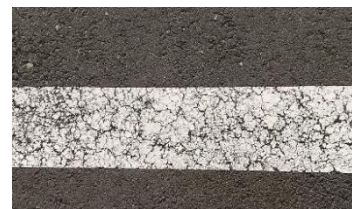
From road trips "MuroRunn" 2020

サウンドクリエイター・ヴィジュアルアーティストである“LouieTokyo Louie”(なめらかカワイ音楽事務所)による映像作品。車窓からみえる「線」をテーマにし撮影された写真をつなぎあわせた、北海道から東京へ向かうロードトリップ・ムービー。