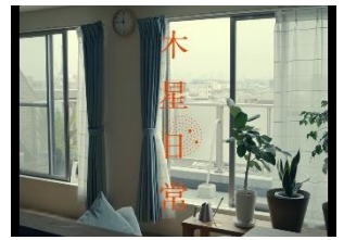
Title of A Jupiter Day

映画監督・脚本家の村口知巳（『美しいロジック』、『ナナサン』）が初めて企画プロデュース・脚本を担当し、監督に新進気鋭の宮原拓也（『sweep.』、『ルーティン』）、撮影にビデオグラファーの村上岳を迎え、リリカルでスタイリッシュな短編映画を制作。キャストには今注目の若手俳優、笠松七海と本庄司を起用し、日常と非日常のアンニュイな交わりと愛の行方の物語を描きました。