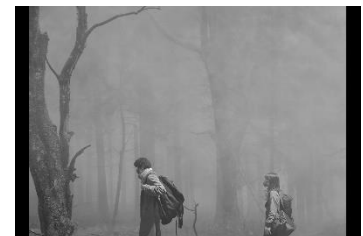
『楽園の船』シーン画像

本作は、現在人々を苦しめているコロナ禍の中で生まれました。この未曾有の事態において、そうなるのは欲しくない未来がここにあります。撮影は、最低限の人数(俳優とカメラのみ)で行う為に全編グリーンバックで行いました。これにより、感染防止を含め、効率的な撮影を行うことができました。コロナが無ければ生まれなかった作品ですが、私にとっては自分の為に作らなければならなかった作品でした。今は大変な状況ですが、私たちの物語は続いていきます。より良い未来を迎えるために、今の自分に出来ることをしようと思います。