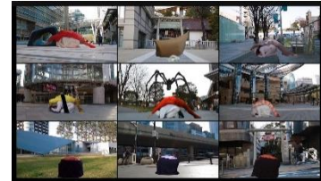
Socially Distanced Sushi Performance 2021

ピーッ！六本木の街から聞こえる笛の合図で、画面上に「寿司」たちが集まってくる！？zoomを使い、それぞれの家からリアルタイムでパフォーマンスに参加してもらいました。リモートでパフォーマンスを行うことで、コロナ禍で人々が触れ合う・集うことが難しい状況下での、新しい「寿司パフォーマンス」の形を提示します。背景に、「今」の六本木の風景や、生活空間である「部屋」を用いることで、緊急事態宣言下の街の様子や、人々の暮らしもパフォーマンスの一部として記録する試みです。