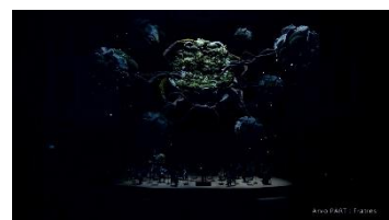
フラトレス (アルヴォ・ベルト作曲)

2020年10月13日、ウィズコロナでの新たな「音楽会」がリアルと配信の世界で「双生」した。コンサート会場での音楽鑑賞は生の音楽の身体性と祝祭性がテーマ。「密を避ける」という今の状況は、演奏会のスタイルの変容を私たち迫りました。《双生する音楽会》では、リアルとオンラインによる2つの全く異なるコンサートを提示。オンライン観賞を劇場観賞の単なる代替手段とせず、オンラインにしかできない新しい鑑賞体験を創り上げました。