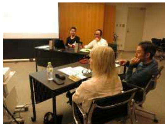
【第2回】スタジオ訪問・面談の様子