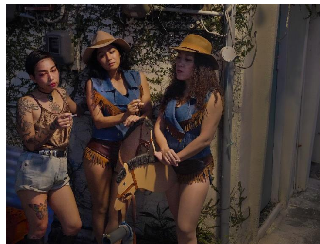
《チンビン・ウェスタン 家族の表象》2019

「話しているのは誰？現代美術に潜む文学」(国立新美術館、東京、2019) 「Asia Pacific Breweries Foundation Signature Art Prize 2018」(シンガポール美術館、シンガポール、2018) 「あいちトリエンナーレ2016」(旧明治屋栄ビル、名古屋、愛知、2016) 「第2回 恵比寿映像祭 歌をさがして」(東京都写真美術館、東京、2010) など。