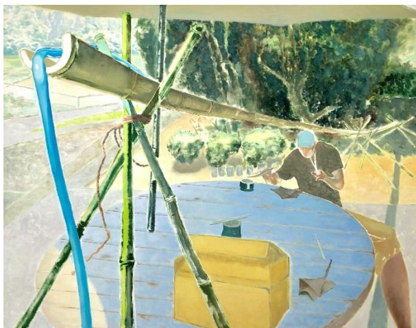
1. 《突貫風情》油彩、キャンバス 2018

TWS-Emerging 2016 参加、2016 年トーキョーワンダーウォール賞受賞