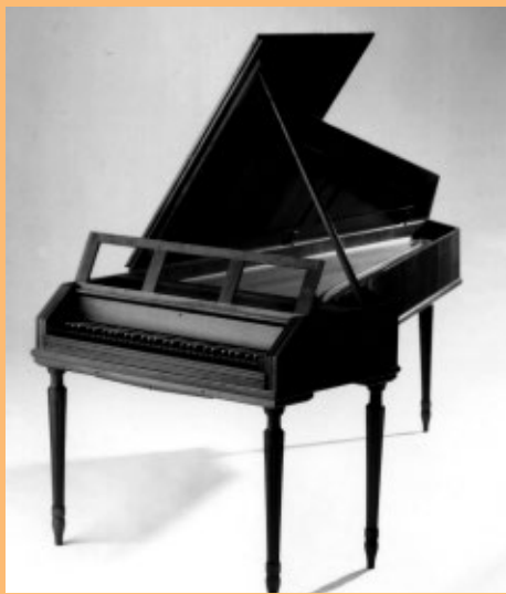
J.A.シュタイン(1790年モデル) 鍵盤61鍵 ピッチ430Hz アメリカ・ツッカーマン社製 山本宣夫改造/仲道郁代所蔵

東京芸術劇場が2020年、5回にわたってお届けする「ミーツ・ベートーヴェン・シリーズ」。その初回に登場する仲道郁代は、ベートーヴェンのピアノ作品がその作曲当時使っていた楽器の表現特性を最大限に反映させて作曲されていることを深く理解しているピアニストのひとりである。今回はシュタイン製、ブロードウッド製のフォルテピアノとモダンピアノ(ヤマハCFX)の3台を弾き分けて、ベートーヴェンのピアノ曲の神髄に迫る。ベートーヴェン・イヤーの幕開けにふさわしい、仲道郁代渾身のベートーヴェンに期待が膨らむ。