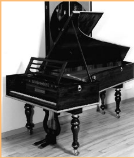
ブロードウッド(1816年モデル) 鍵盤71鍵 ピッチ430Hz ジョン・ブロードウッド&ソンス社(ロンドン)製 山本宣夫修復/仲道郁代所蔵

仲道郁代 Ikuyo Nakamichi◎桐朋学園大学1年在学中に第51回日本音楽コンクール第1位、増沢賞を受賞。ジュネーヴ国際音楽コンクール最高位、メンデルスゾーン・コンクール第1位メンデルスゾーン賞、エリザベト王妃国際音楽コンクール第5位と受賞を重ね、以後ヨーロッパと日本で本格的な演奏活動を開始。これまでに国内の主要オーケストラはもとより、マゼール指揮ピッツバーク交響楽団、バイエルン放送交響楽団、フィルハーモニア管弦楽団、ズッカーマン指揮イギリス室内管弦楽団(ECO)、フリーベック・デ・ブルゴス指揮ベルリン放送交響楽団、P.ヤルヴィ指揮ドイツ・カンマーフィルハーモニー管弦楽団など海外オーケストラとも多数共演。CDはソニー・ミュージックジャパンと専属契約を結び、レコード・アカデミー賞受賞。CDを含む「ベートーヴェン:ピアノ・ソナタ全集」他、「モーツァルト:ピアノ・ソナタ全集」等、高い評価を得ている。著書に『ピアニストはおもしろい』(春秋社)等がある。2018年よりベートーヴェン没後200周年の2027年に向けて「仲道郁代 Road to 2027プロジェクト」をスタートし、リサイタルシリーズを展開中。一般社団法人音楽がヒラク未来代表理事、一般財団法人地域創造理事、桐朋学園大学教授、大阪音楽大学特任教授。 オフィシャル・ホームページ http://www.ikuyo-nakamichi.com