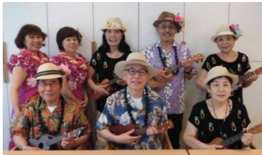
ウクレレ・フラダンス 「リム&ハッチと仲間達」

地元イベントに出演するなど精力的に活動する小学生バンド。カバーだけでなく、オリジナル歌詞を作詞して演奏を行っている。