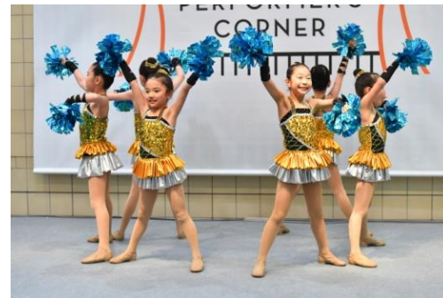
「第 1 回トパコ」の様子

東京都及びアーツカウンシル東京(公益財団法人東京都歴史文化財団)は、11 月 4 日(日)に三井アウトレットパーク多摩南大沢にて、「第 2 回トパコ(都民パフォーマーズコーナー)」を開催します。