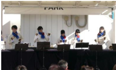
TAMA カルチャーカレッジ 「ハンドベル」講座

開講以来まもなく 8 年目を迎える「ハンドベル」教室。高校生から大人まで幅広い年代が集まり、心安らぐ音楽を演奏する。