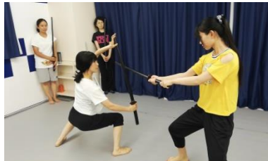
初心者女子のダンス教室 「FANTASY」

開講以来まもなく 8 年目を迎える「ハンドベル」教室。高校生から大人まで幅広い年代が集まり、心安らぐ音楽を演奏する。