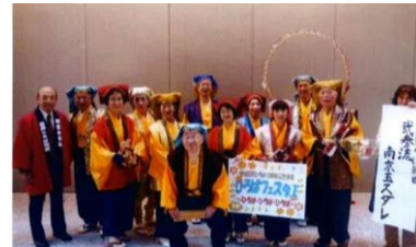
「弐参流 南京玉スダレ」

都内でボランティアを行っているシニアグループ。大人から子供まで、観客も一緒に楽しく歌えるような幅広いジャンルの曲を演奏する。