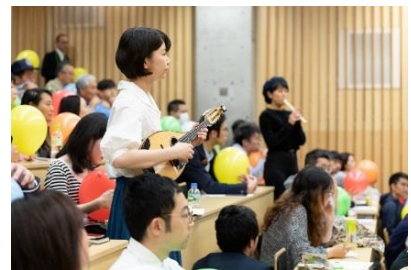
平成30年5月13日(日)に開催した第5回 TURN ミーティング