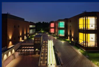
東京都美術館 (上野)