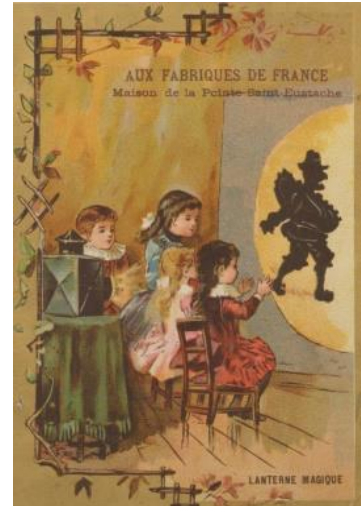
作者不詳 《マジック・ランタンのトレード・カード》 19世紀 フランス