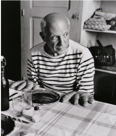
ロベール・ドアノー 《ピカソのパン》 1952年

東京都写真美術館のコレクションを紹介する展覧会シリーズの第2期。今年は「たのしむ、まなぶ」をテーマに、34,000点を超える当館のコレクションの中から、子供から大人まで、鑑賞者の好奇心をかきたて、遊び心をふくらませる魅力的な作品を紹介します。