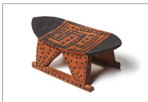
制作者不詳(ワイワイ)《イス》