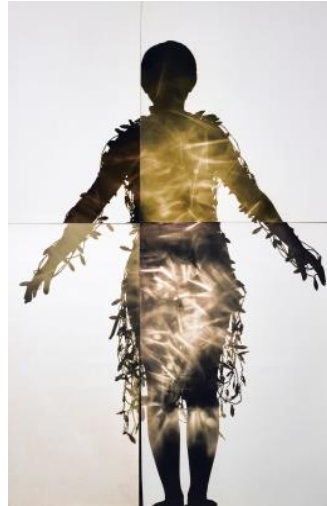
杉浦邦恵 《電気服にちなんで Ap2、黄色》 2002年