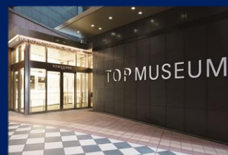
東京都写真美術館 (恵比寿)