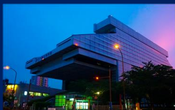
東京都江戸東京博物館 (両国)