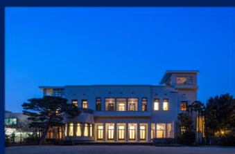
東京都庭園美術館 (目黒)