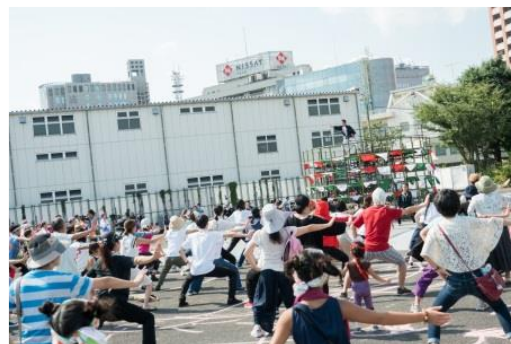
東京キャラバン in 八王子(2017年)