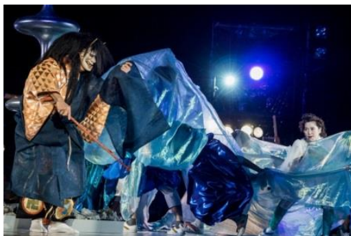
東京キャラバン in 京都(2017年)