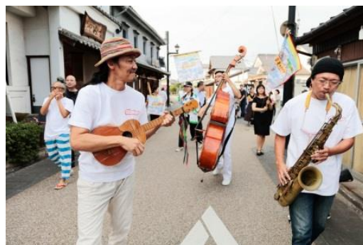
東京キャラバン in 熊本(2017年)