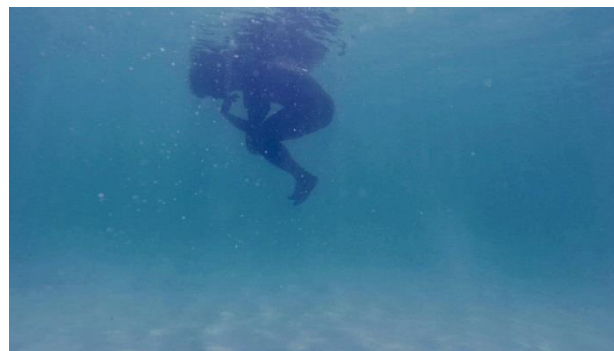
6 潘 逸舟 《海で考える人》 2016 映像