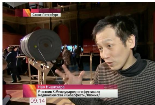
TV ニュース ロシア 1 チャンネル 2017、テレビ電波、可変 https://www.1tv.ru/news/2017/01/26/