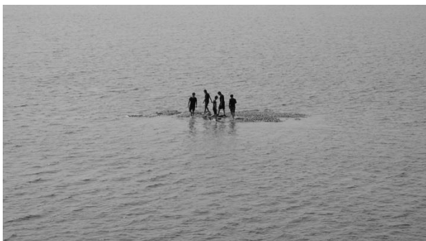
5 潘 逸舟 《Musical Chairs》 2015 映像インスタレーション、スクリーン