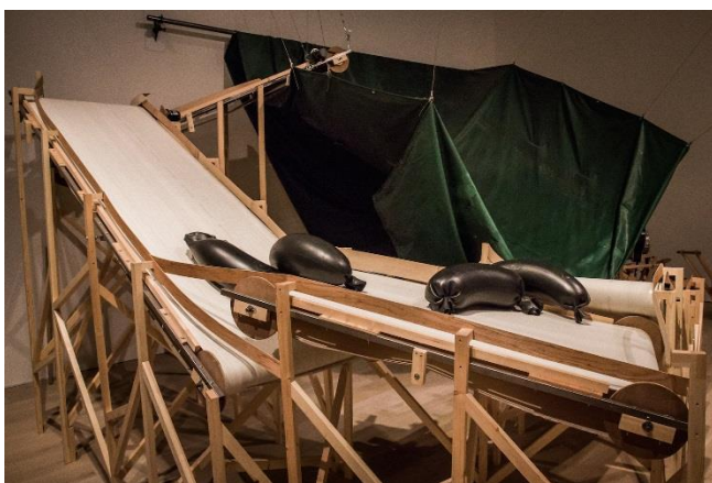
3 西原 尚 《プリンプリン》 2016 ミクストメディア 展示風景：「六本木クロッシング 2016 展：僕の身体、あなたの声」（森美術館）