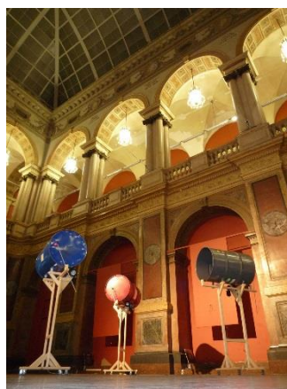
4 西原 尚 《ドラム缶》 2017 ドラム缶、モーター、車輪、ゴムボール、アルミニウム棒、木材 展示風景：「CYFEST 10」（St. Petersburg Stieglitz State Academy of Art and Design、2017）