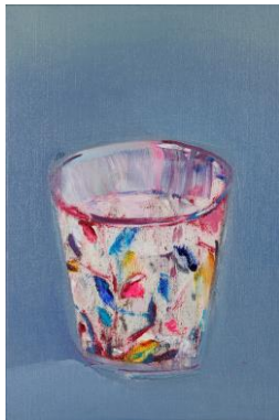
阿部彩葉子《グラス》2015