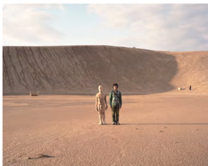
1. 《おぼえておきたいこと》2011～ 写真、映像、立体