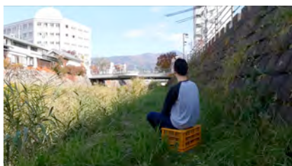
1. 《あれは、私の父です》2016 映像