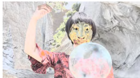
《二つの心拍》 2016 映像

2012年東京造形大学大学院造形研究科造形専攻美術研究領域修了。 主な展覧会に「NEW VISION SAITAMA 5 迫り出す身体」（埼玉県立近代美術館、2016）、「終いには宇宙をつくった。」（Art Center Ongoing、東京、2016）、「Unusualness Makes Sense –Alternative Art Practices by Thai and Japanese Artists」（チェンマイ大学アートセンター、タイ、2016）、「アートアワードトーキョー丸の内 2012」（行幸地下ギャラリー、東京、2012）など。