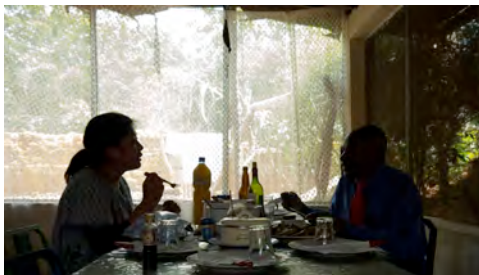
《お父さんと食事》 2015 映像インスタレーション

2012年東京藝術大学大学院美術研究科博士後期課程修了。 主な展覧会に「トーキョー・ストーリー2014」（TWS本郷、2014）、「もう1つの選択 Alternative Choice」（横浜市民ギャラリーあざみ野、神奈川、2015）、「近づきすぎではいけないーHave a meal with Fatherー」（TALION GALLERY、東京、2015）など。その他、「知らない路地の映画祭」（千住・縁レジデンス、千住庁舎会議室（旧ミリオン座）、東京、2016）。