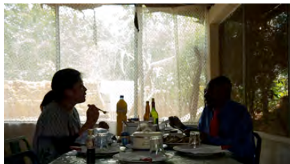
2. 《お父さんと食事》2015 映像インスタレーション