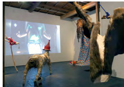
3. 《Last space》2016 ミクストメディア