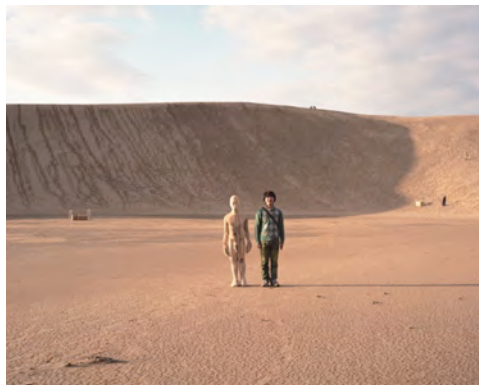
《おぼえておきたいこと》 2011~ 写真、映像、立体

2014年東京藝術大学大学院美術研究科先端芸術表現専攻修了。 主な展覧会に「まちをとらえるー記憶のドキュメント」（藤沢市アートスペース、神奈川、2016）、「トーキョー・ストーリー2015」（TWS本郷、2015）、「未見の星座<コンステレーション>」（東京都現代美術館、2015）、「藤沢今昔まちなかアートめぐり」（神奈川、2010-2016）など。その他、「小豆島アーティスト・イン・レジデンス（小豆島AIR）」（小豆島町、香川、2014）。