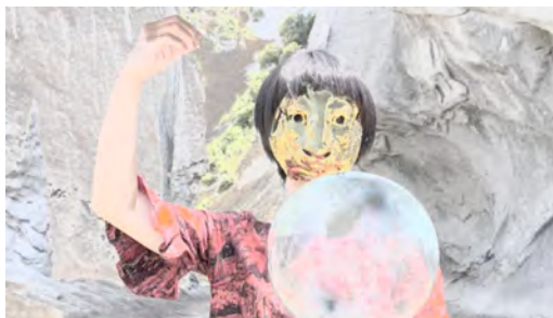
2. 《二つの心拍》2016 映像