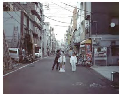
3. 《被服を巡るドレミファ》2014 写真、映像、立体