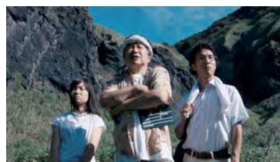
3. 自主制作映画《トンネル》2015 映像