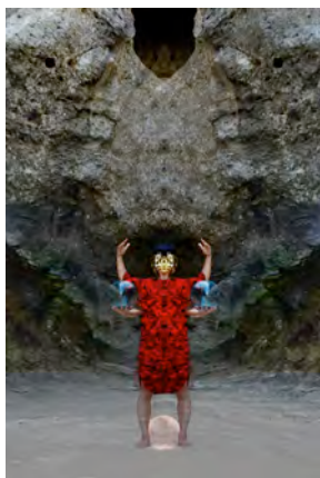
1. 《Two heartbeats》2016 写真