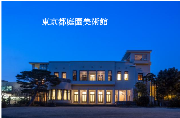
東京都庭園美術館

また、各都立文化施設では、感動と驚きをお届けするさまざまな夏の催しを行います。お子様の夏休みの自由研究や宿題対策などにも是非ご活用ください。(別紙2)